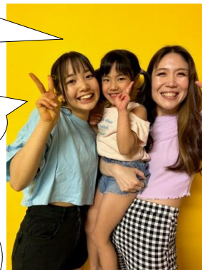
Aさん(14歳・通学歴12年) Aちゃん(5歳・通学歴5年) Naho先生